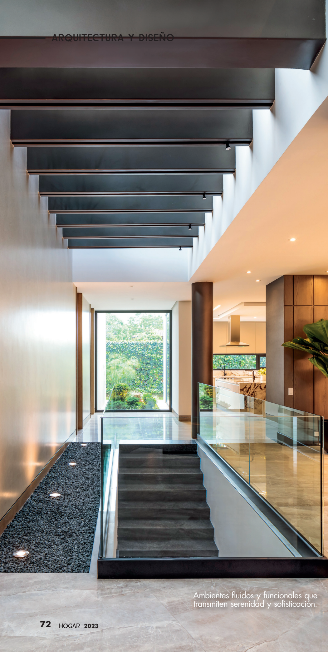
Ambientes fluidos y funcionales que transmiten serenidad y sofisticación.