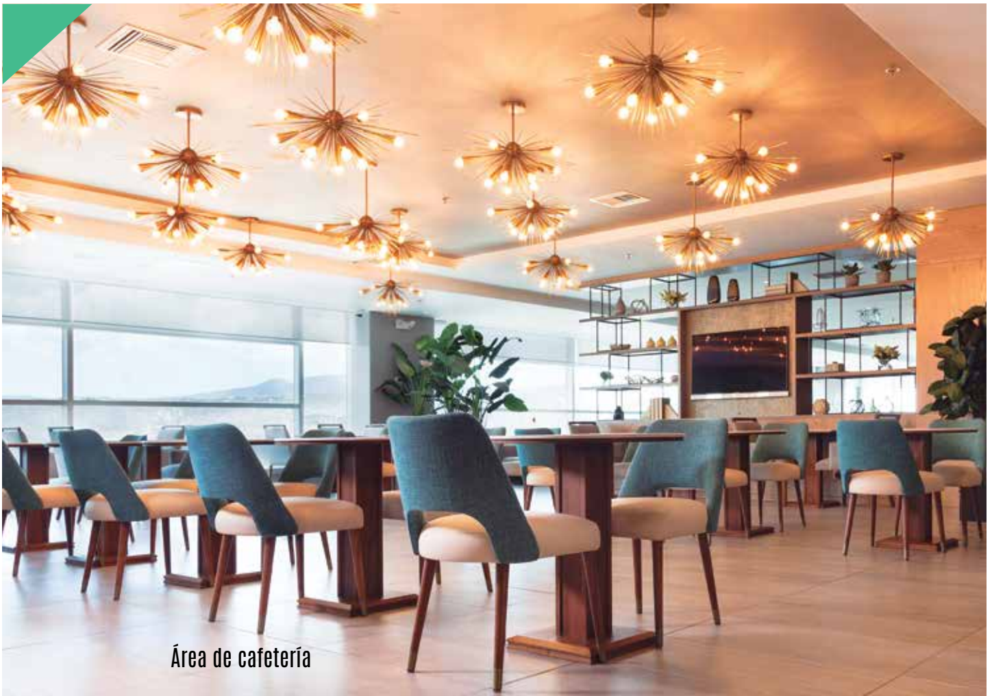
Área de cafetería

» avión y senderos en el cielo. El juego de materiales como el cuero, la pintura metalizada, el mármol y la iluminación tuvo como objetivo crear un ambiente de lujo.